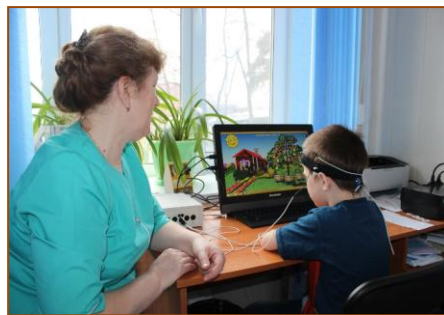
Тренинг по ЭЭГ-концентрация внимания.