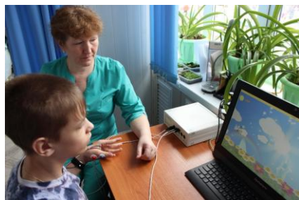
Проведение тренинга ЭМГ-приведение большого пальца к мизинцу.